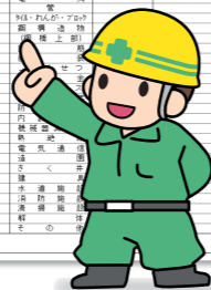
激変緩和シミュレーション (比較表)